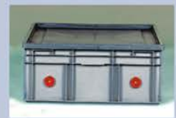
Größe 1 75 x 55 x 32 (innen) Gewicht 6,3 kg Volumen 130 Liter