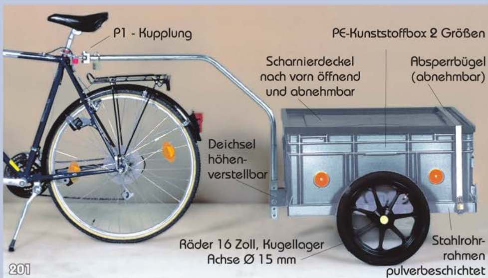
Zuladung 50 kg. Als Handwagen 100 kg. Leergewicht 11 kg ohne Box.

Fahrgestell aus Profilstahlrohr geschweißt und pulverbeschichtet. Anschluß am Fahrrad mit der Kugelgelenkkupplung P1 an der Sattelstütze oder P1-TD Tiefdeichsel am Hinterradrahmen. Hochdeichsel verstellbar für waagrechte Lage des Anhängers. Alternativ mit einfach abnehmbarer Steckdeichsel (siehe Zubehör) und verstellbarem Standrohr. Aufsteckbare Kunststofffelge 16 Zoll mit Luftbereifung 16 x 1,75 und Präzisionskugellager oder Stahlfelge 16 Zoll mit Luftbereifung 16 x 2,125 und Präzisionskugellager (empfehlenswert bei starker Beanspruchung).