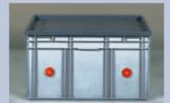
Größe 2 75 x 55 x 42 (innen) Gewicht 7,2 kg Volumen 175 Liter Großer Einkaufswagen